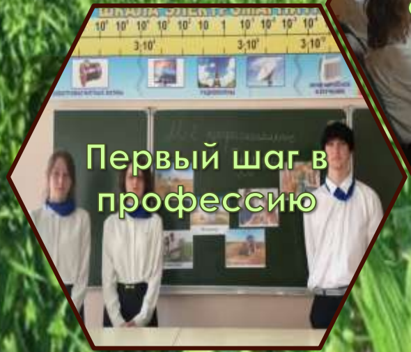
Первый шаг в профессию