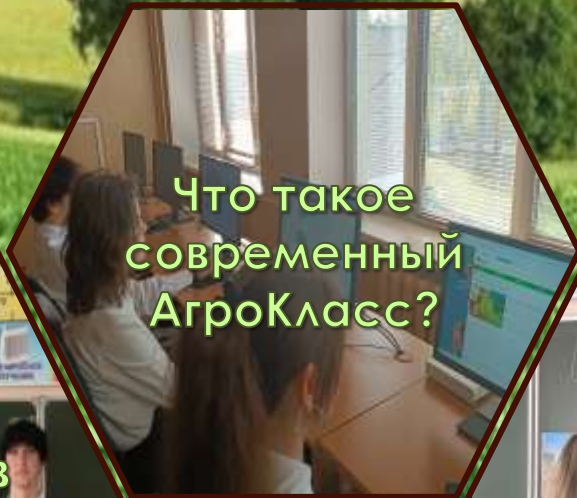
Что такое современный АгроКласс?